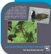
LA VIE AU BORD DU RUPT DE MAD Une faune discrète mais riche

De 1749 à nos jours, comparaison de cartes