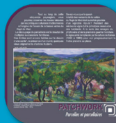
PATCHWORK Parcours et paysages